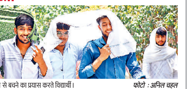
रोहतक। चिलविलाती गर्मी में धूप से बचने का प्रयास करते विद्यार्थी।