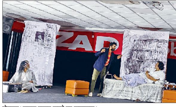
रोहतक। नाटक प्रस्तुत करते हुए कलाकार।

स्थानीय ओमेक्स सिटी स्थित जैड ग्लोबल स्कूल के सभागार में हुई साइक्लोरोमा दिल्ली की प्रस्तुति ‘ढेके पर मुशायरा’ में दर्शकों को न केवल हास्य नाटक का आनंद