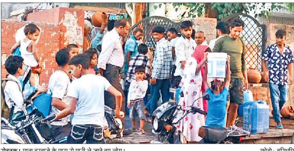
रोहतक। माता दरवाजे के पास से पानी ले जाते हुए लोग।