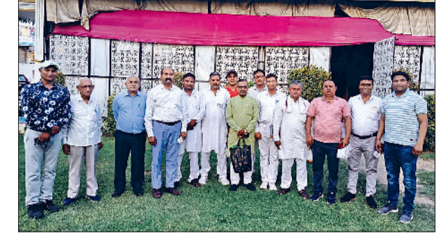
रोहतक। बैठक के दौरान डूम समाज कल्याण सभा के सदस्य।